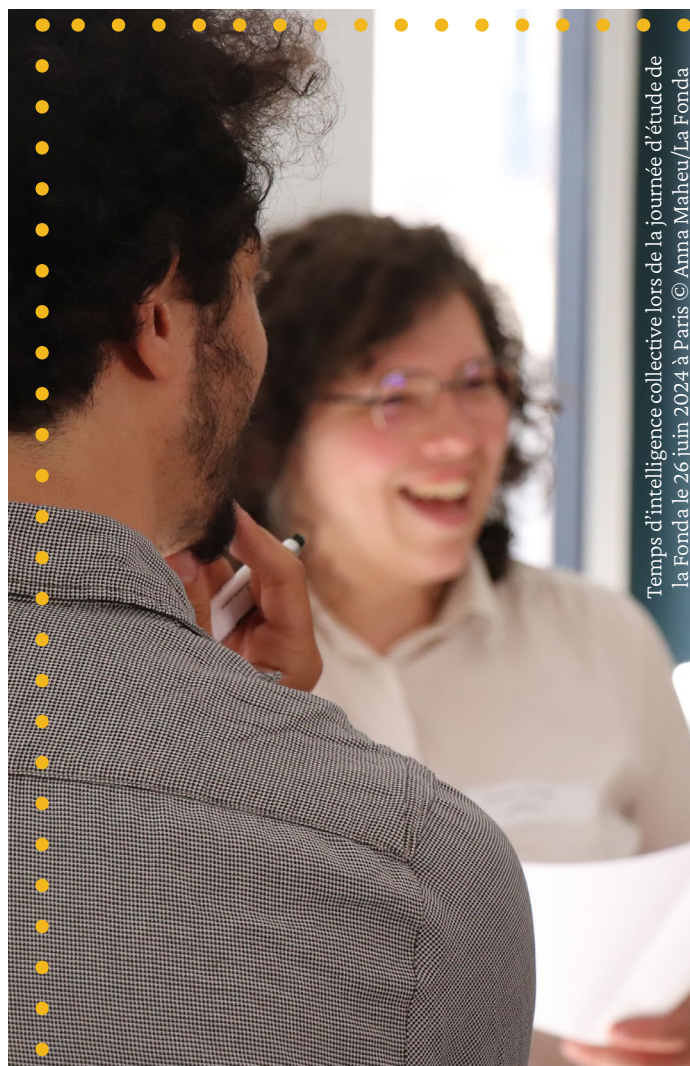
Temps d'intelligence collective lors de la journée d'étude de la Fonda le 26 juin 2024 à Paris