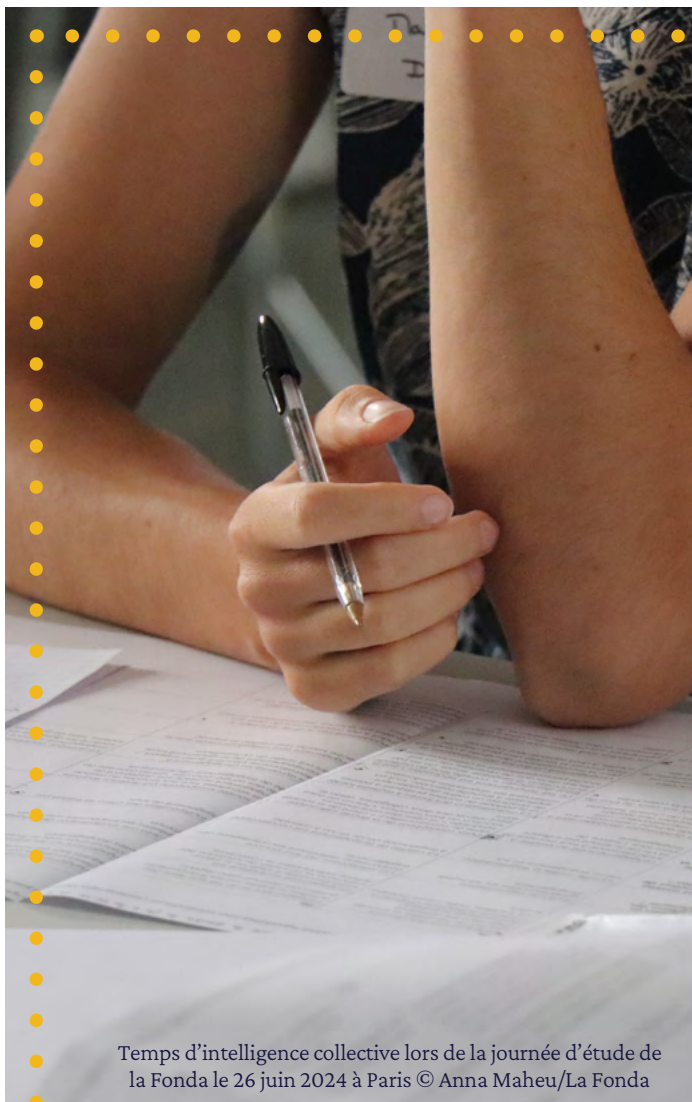
Temps d'intelligence collective lors de la journée d'étude de la Fonda le 26 juin 2024 à Paris

Le parcours est composé de six modules complémentaires et cohérents. Les modules peuvent cependant être suivis indépendamment les uns des autres, selon les besoins de chacun.