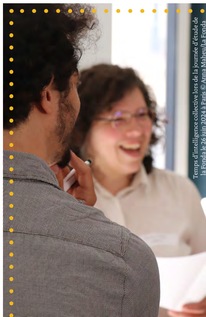
Temps d'intelligence collective lors de la journée d'étude de la Fonda le 26 juin 2024 à Paris